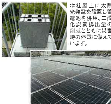
太陽光発電を併用し、蓄電池を併用し、二酸化炭素排出量を削減しています。