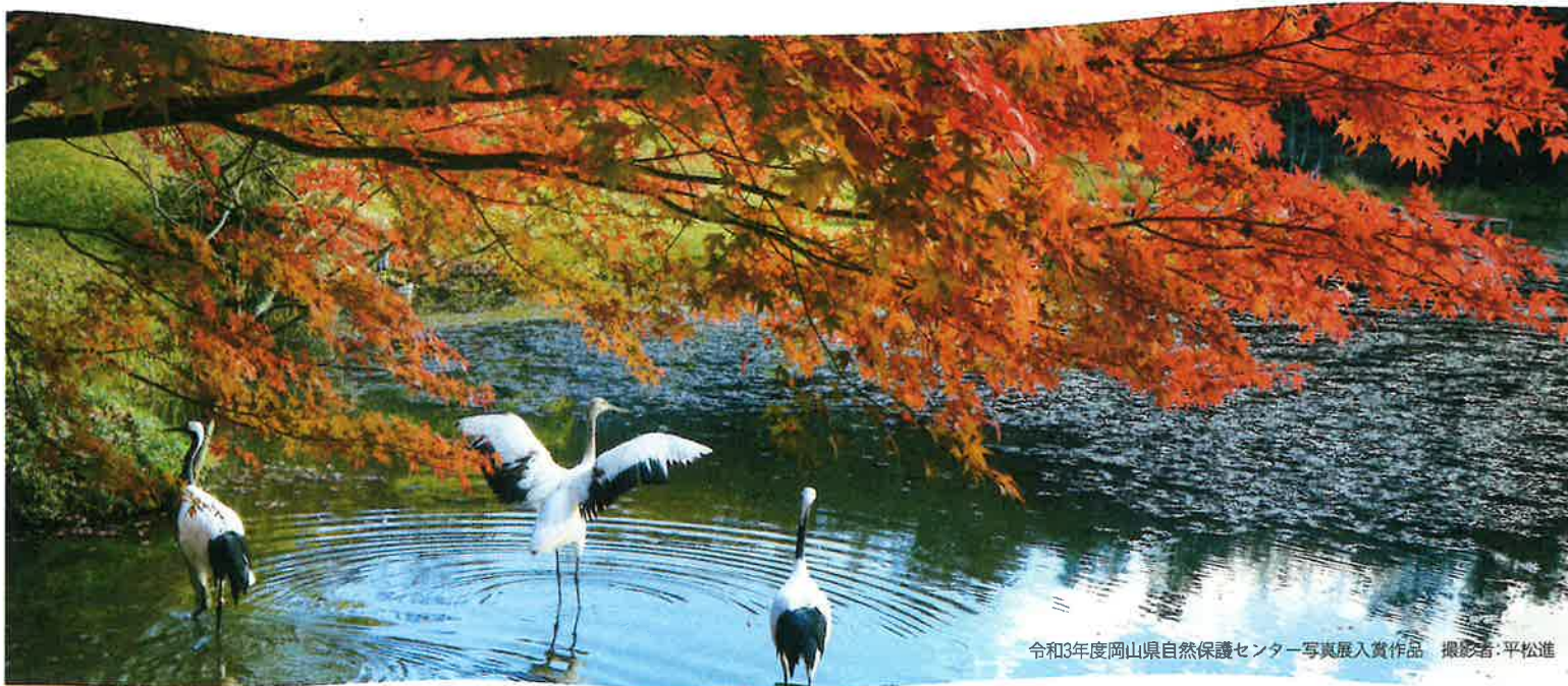
令和3年度岡山県自然保護センター写真展入賞作品